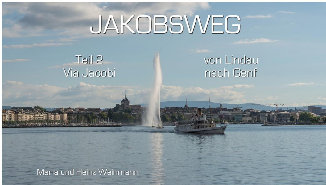
Jet d'Eau, Genf