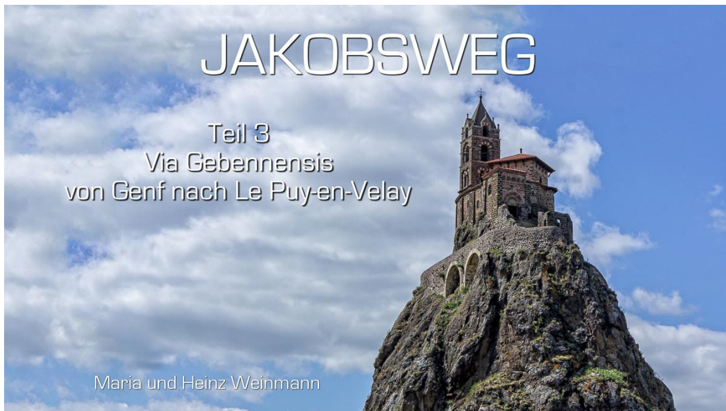
Chapelle St-Michel-d'Aiguilhe, Le Puy-en-Velay