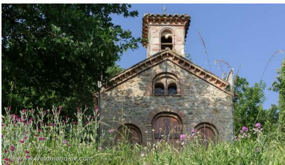
Chapelle du Calvaire, Chavanay