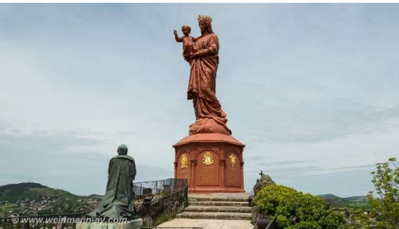
Notre-Dame de France, Le Puy-en-Velay