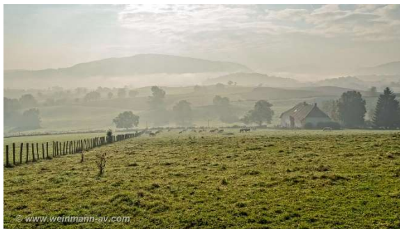
bei le Pin