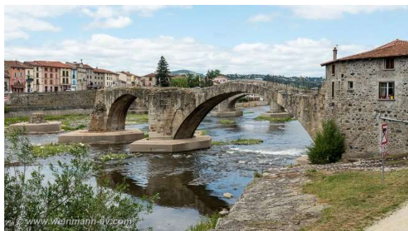
Römerbrücke in Brives-Charensac