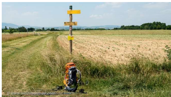
noch 13 km bis Chavanay